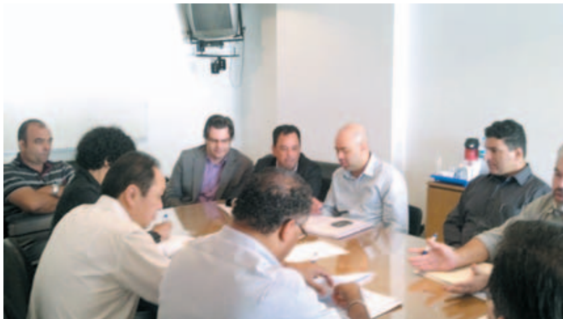
Dirigentes do SINEEPRES e da FEACONSPAR em negociação coletiva com o sindicato patronal (SIESE - PR)

Entre suas propostas, estão projetos para a geração de empregos, redução do ISS - Imposto sobre Serviços; prevenção às drogas e estímulo aos esportes e a valorização e respeito à cidadania.